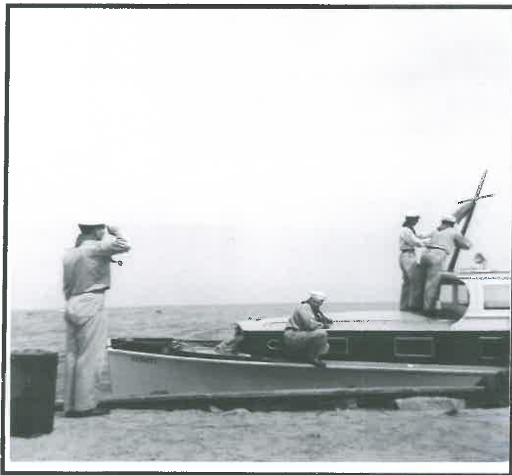
Посвячення ЧМ Вишкільного Яхту "Крим". Піднесазя прапору Української Державної Фльоти.